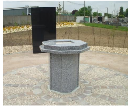
Lieu où sont déposées les cendres du défunt

Article 1 : Conformément aux articles R2213-39 du Code Général des Collectivités Territoriales, à la demande des familles, les cendres des défunts peuvent être déposées dans le dispersoir. Chaque dispersion est inscrite sur un registre tenu en Mairie. L'autorisation délivrée par le Maire, un agent communal est présent lors de la Cérémonie.