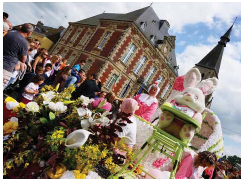
La grande parade du dimanche après-midi est l'occasion, pour les stérpinaciens de tous âges, de se retrouver pour un moment de fête et de convivialité

Dimanche après-midi , place à la fête et aux retrouvailles entre amis dans les rues de la ville animées par la multitude de chars et de groupes venus semer une joyeuse pagaille . La grande parade s'élancera de la rue Saint-Maur pour terminer sa folle cavalcade devant le parvis de la mairie. Bien sûr, la fête ne serait pas complète sans les manèges et attractions foraines attendus avec ferveur par les plus jeunes des stérpinaciens. Les forains s'installent dans la ville du samedi au lundi. Alors, que les écoliers n'oublient pas de venir retirer en mairie un bon pour un tour de manège gratuit (lire ci-contre).