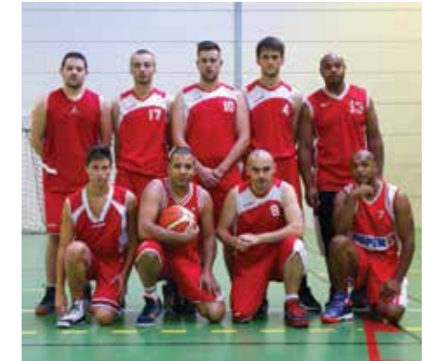
Après avoir gagné la coupe de l'Eure en 2014-2015, l'équipe 2 seniors monte en Honneur Départemental

Après le maintien assuré pour les premiers, la victoire de l'équipe B contre Beuzeville (59-37) le 10 avril dernier lui a permis de remplir le contrat. C'est pour le club la perspective d'évoluer à un niveau plus haut et de pouvoir recruter de nouveaux joueurs pour viser la promotion d'excellence.