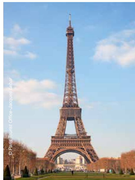
En 2016, 250 personnes sont parties en voyage avec la municipalité

Infos : echangesetpartage@sfr.fr ou au 06 15 43 73 13