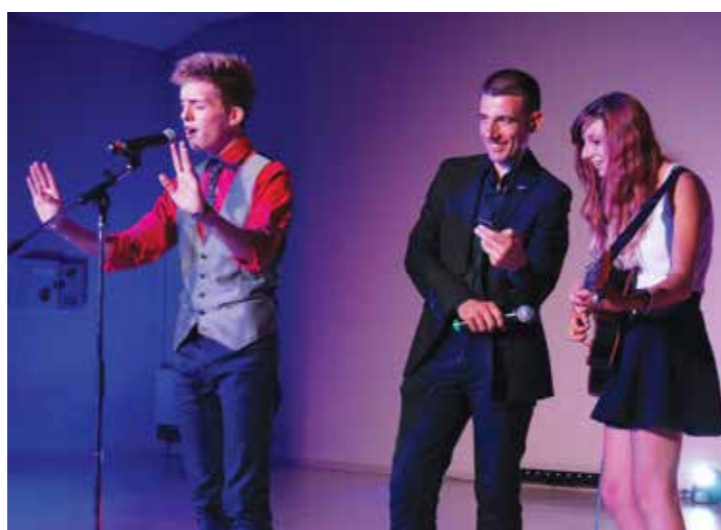
Le vendredi soir à 21h, salle Jacques-Brel, Scène ouverte aux talents : entrée gratuite

Musique, danse, cavalcade, confettis, déguisements et manèges... La recette reste inchangée et fonctionne toujours aussi bien auprès des petits et des grands, ravis d'investir les rues de la ville pour un sympathique chahut.