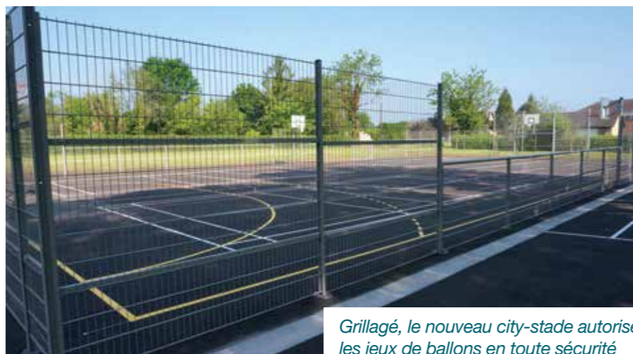
Grillagé, le nouveau city-stade autorise les jeux de ballons en toute sécurité

Une fois n'est pas coutume, les parents ont eu la permission de profiter eux aussi de la cour de récréation flambant neuve de l'école Georges-Delamare. En effet, lors de la journée portes ouvertes du 28 mai, 150 d'entre eux sont venus découvrir les nouveaux aménagements ludiques et pédagogiques de l'équipement : une réalisation assez exceptionnelle qui n'existe que dans très peu d'établissements scolaires.