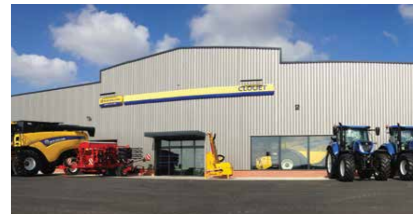
Les Ets Clouet fournissent des tracteurs de 30 à 500 ch, des moissonneuses-batteuses, semoirs, bennes, broyeurs, pulvérisateurs et matériels de fenaison...

Les Établissements Clouet, spécialistes de la machine agricole, viennent d'inaugurer officiellement leurs nouveaux locaux de la Porte Rouge.