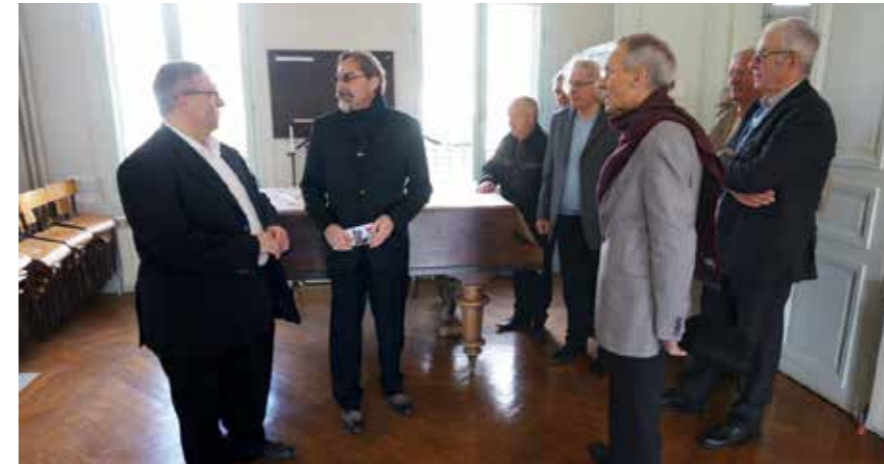
À l'école de musique, M. le sous-préfet a pu se rendre compte de l'intérêt, pour les élèves et les professeurs, de nouveaux locaux mieux adaptés