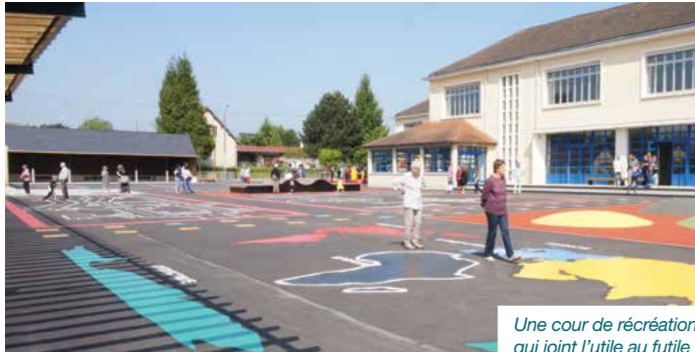
Une cour de récréation qui joint l'utile au futile

Ces aménagements financés en partie par le Département permettent désormais de profiter pleinement des 3 600 m 2 de cour de récréation et des 3 200 m 2 du terrain de sport.