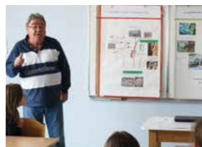
* Nouvelles activités péri-scolaires

Ces ateliers, dirigés sur le développement durable et la nature leur ont aussi permis d'apprendre une multitude de choses sur la faune et la flore.