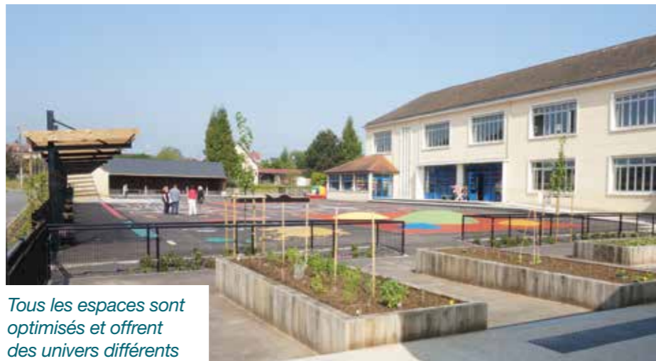
Tous les espaces sont optimisés et offrent des univers différents

Marelle, planisphère, piste routière, dômes souples pour exercer sa motricité, jardin pédagogique... L'ensemble propose de multiples possibilités d'apprendre et de s'amuser , ajoutant ainsi à cet espace de liberté la fonction complémentaire d'espace de créativité. De quoi susciter encore un peu plus de nostalgie scolaire chez les visiteurs adultes !