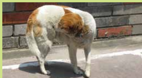
Laisser son chien divaguer est interdit

Les incitations à un comportement civique restant sans effet sur certains, le conseil municipal a décidé de sévir et d'infliger une amende significative aux récidivistes.