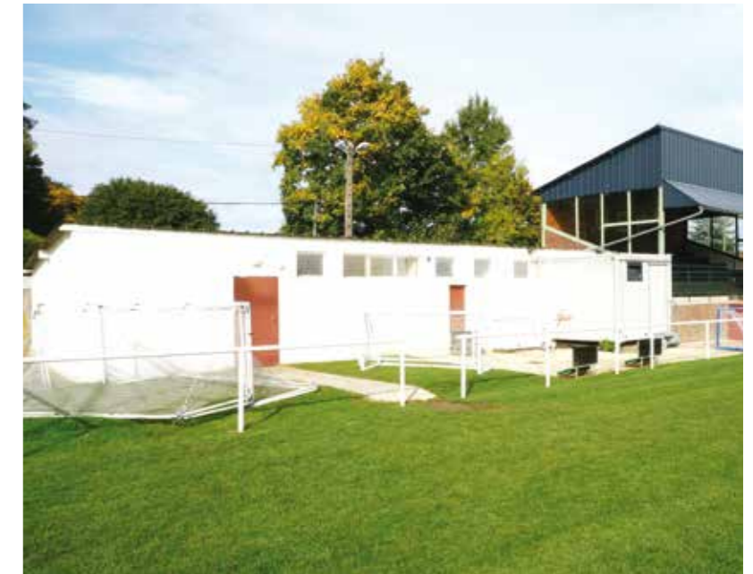
Les anciens vestiaires devenus vétustes laisseront place à un nouveau bâtiment offrant toutes les conditions de confort et d'hygiène