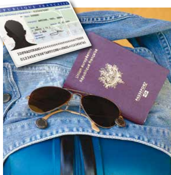
Penser à vérifier la date de péremption de sa pièce d'identité pour la faire renouveler à temps avant le départ : une sage précaution !