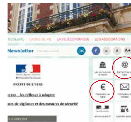
Les rubriques sont accessibles directement depuis la page d'accueil

Le nombreuses démarches sont réalisables à partir du site internet de la ville : la rubrique « démarches en ligne » permet de réaliser de chez soi des demandes d'actes de naissance, de mariage ou de décès et d'accéder à une foule d'informations sur ses droits et la vie quotidienne (déménagement, logement, allocations familiales...). Les documents demandés en ligne seront adressés par courrier à la personne. La rubrique « paiement en ligne » offre aux parents la possibilité de régler directement les frais de cantine.