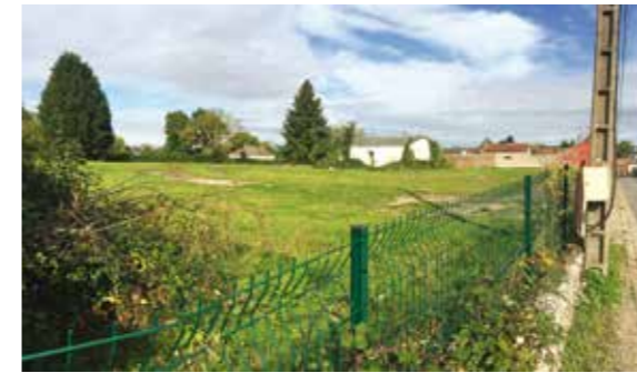
L'ancien terrain de BP laissera bientôt place à un parking de 100 places de stationnement

Le stade de football de la ville va subir une véritable opération de rajeunissement avec la construction de nouveaux vestiaires-sanitaires et l'aménagement d'un parking d'une capacité de 100 places sur le terrain occupé anciennement par BP. La maîtrise d'œuvre a été confiée au bureau d'études AACD à Vernon. Les travaux commenceront début 2018.