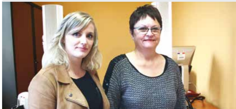
Les agents vous accueillent pour vos demandes de papiers d'identité

UNIQUEMENT SUR RENDEZ-VOUS AU 02 32 55 71 44